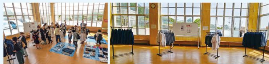
▲制服リユース販売の様子

制服リユース販売は土曜参観後に実施しています。地元のクリーニング店「クリーンショップおくむら」様のご協力により1着1着丁寧に、無償で制服クリーニングを実施していただき、衛生的かつ綺麗になった制服に、たくさんの保護者や生徒が「気持ちよく安心して着用できる」と、販売開始前から行列ができるほど毎年大盛況のイベントです。