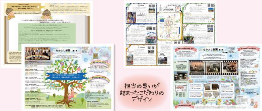
担当の思いが詰まったこだわりのデザイン

なかよし新聞 年3回、市立幼稚園15園のPTA会員さんへ向けて発行している新聞で、主に幼P連の会議や研修の様子、各園の活動を紹介しています。以前は印刷物をお配りしていましたが、今年度から新たな試みとしてアプリでの配信となり、カラーで見やすいデザインに工夫しました。より分かりやすく、沢山の方の目に留まるよう、担当で話し合いながら取り組んでいます。