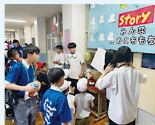
▲春日丘フェスティバルの様子

秋には、文化祭として、春日丘フェスティバルが開催されました。地域の保育園や幼稚園、小学校の子どもたち約200名を招待しました。当日は中学生がキャストとして学校を案内し、教室ではホスト役の中学生がもてなし、小さい子どもたちが楽しめる工夫をされた劇やクイズ、ゲームを楽しんでいました。学校全体が明るい笑顔で溢れる1日となり、広報で参加したPTA役員も心温まるイベントでした。来年度以降も「楽しく活動」をモットーにPTA活動に取り組んでいきたいと思っています。