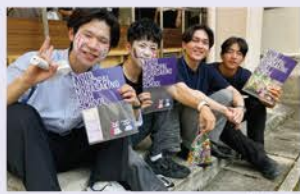
▲クリアファイルを受け取った生徒たち