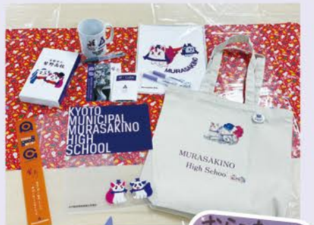
むらこまいぬグッズ