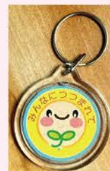
▲はぐちゃんキーホルダー