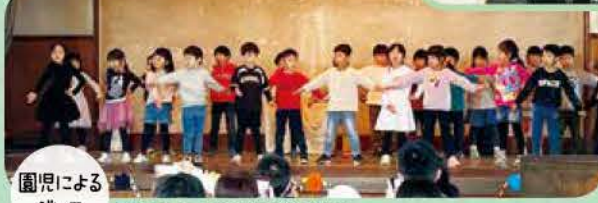
園児による ダンス