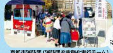
消防団 活動が啓発