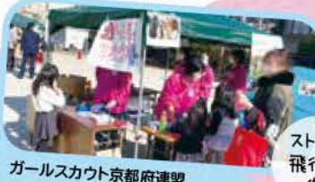
ストロー 飛行機 作り