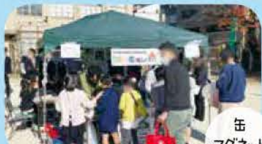
缶 マグネット 作り