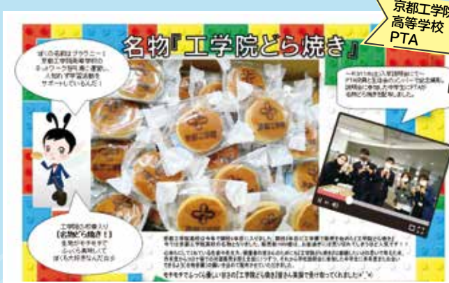
京都工学院 高等学校 PTA

カラフルな画面デザインに目を奪われました。決して映っている特製のどら焼きが目が奪われたわけではありませんよ。さまざま制限の多い中で、可能な限り、生徒たちのかけがえのない青春の時間を確保してあげようという努力をなされているPTAの皆さんの思いがあふれています。