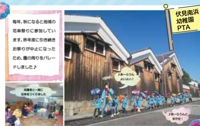
伏見南浜 幼稚園 PTA