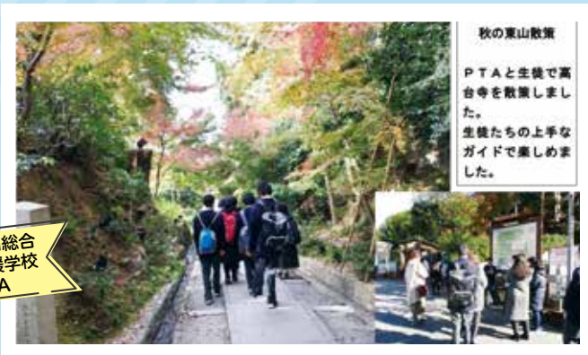
東山総合 支援学校 PTA

新しいPTA始まっています! クラウドシステムを活用したPTA活動で親子時間が充実しました。