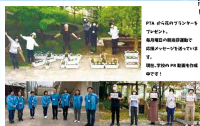
花山 中学校 PTA

保護者も生徒たちもニコニコしながら書いてある文字を読んでおられました。コロナ禍の中、保護者と子どもたちが前向きに一つになれた様な気がします。