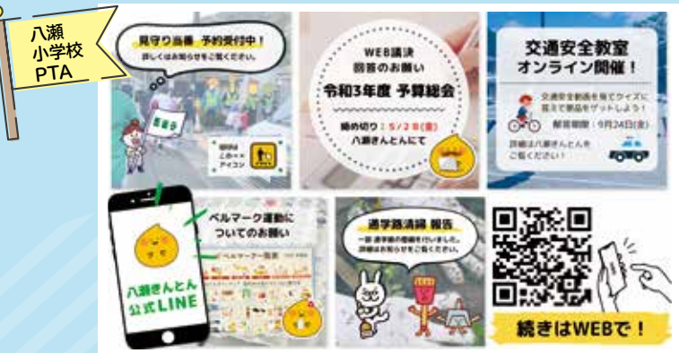
八瀬 小学校 PTA