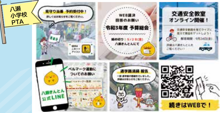
八瀬 小学校 PTA