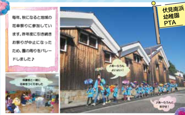
伏見南浜 幼稚園 PTA