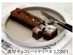
濃厚チョコレート1,728円