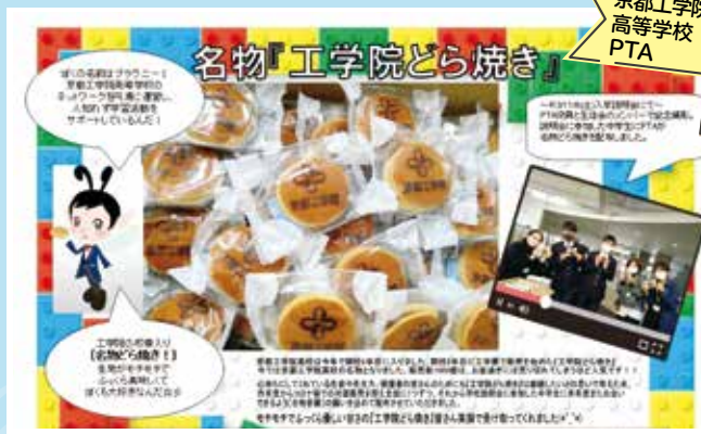
京都工学院 高等学校 PTA

カラフルな画面デザインに目を奪われました。決して映っている特製のどら焼きが目が奪われたわけではありませんよ。さまざま制限の多い中で、可能な限り、生徒たちのかけがえのない青春の時間を確保してあげようという努力をなされているPTAの皆さんの思いがあふれています。