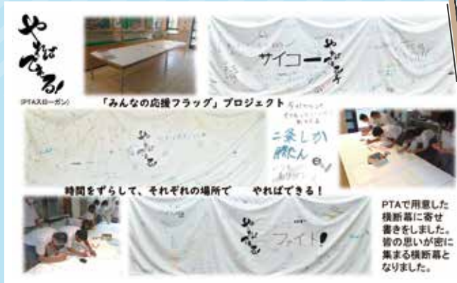
二条 中学校 PTA

Pフェスは既に終わってしまいましたが、もっと皆様にも見ていただきたい、という思いから、本号では、市P連広報委員が独自に写真をセレクトしてみました。