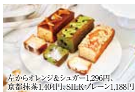
左からオレンジ&シュガー1,296円、京都抹茶1,404円、SILKプレーン1,188円

ホテルで腕を磨いた「菓子職人」が丹精込めて作ったパウンドケーキ。きび砂糖の優しい甘みと、香ばしいバターシンプルな味の「SILKプレーン」ほか、全7種のテイストがあります。