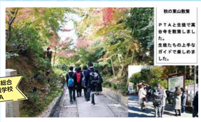
東山総合 支援学校 PTA

新しいPTA始まっています! クラウドシステムを活用したPTA活動で親子時間が充実しました。