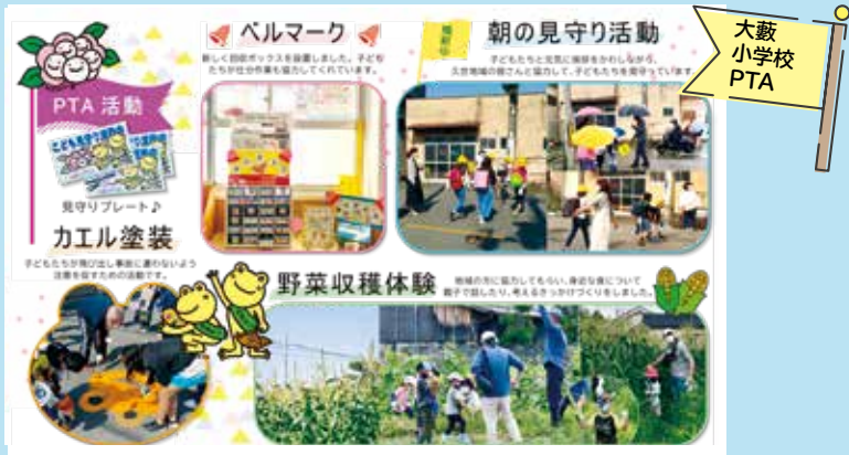
大藪 小学校 PTA