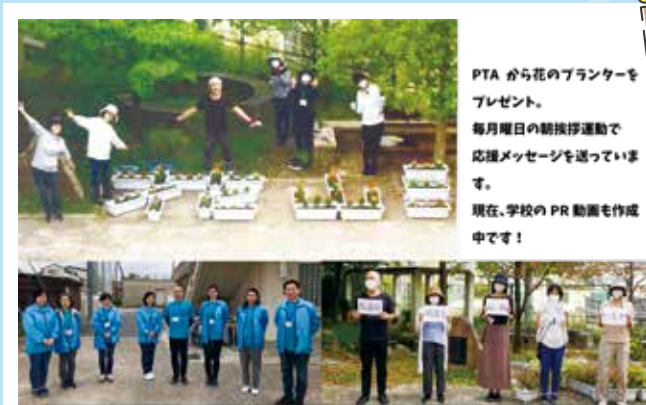
花山 中学校 PTA

保護者も生徒たちもニコニコしながら書いてある文字を読んでおられました。コロナ禍の中、保護者と子どもたちが前向きに一つになれた様な気がします。