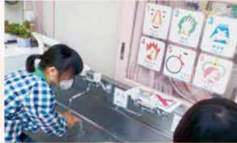
手洗い歌「おねがい、かめさん、お山、オオカミ、バイク、つかまえた!」と、一つずつ丁寧に口ずさみながら手洗いをします。

やりたいことができない環境であっても、これまでの日常に縛られず多くの学びと成長をしています。収束の見えないウイルスとの戦いが続く中、園や保護者、地域の大人達により一層つながりを深めて一丸となり、感染しないための予防を今一度考え、共に乗り越えたいですね。