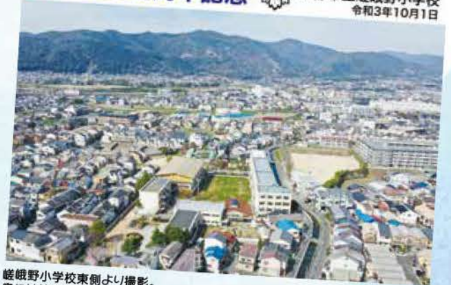
嵯峨野小学校東側より撮影。奥には桂川に架かる渡月橋が望める。