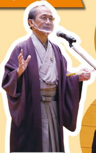
祝辞 門川大作京都市長