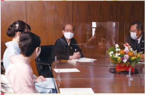
植松会長 昨年、中3の娘が広島に修学旅行に行かせていただき