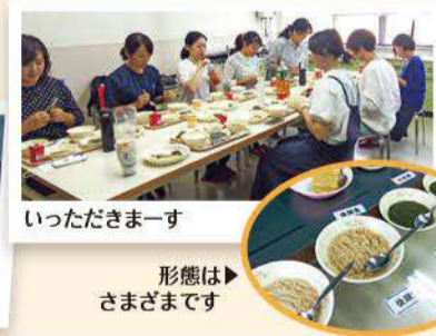
いただきますー 形態はさまざまです