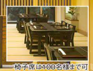
椅子席は100名様まで可