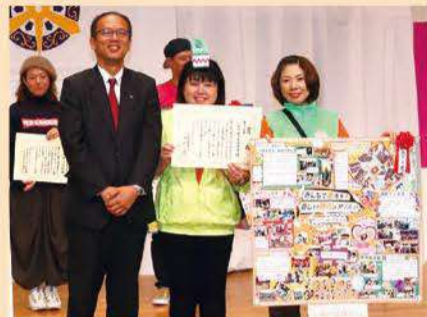
教育長賞 呉竹総合支援学校PTA