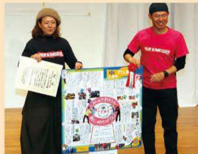
実行委員長賞 上京中学校PTA