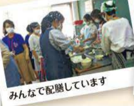
みんなで配膳しています