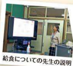
給食についての先生の説明