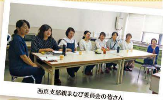
西京支部親まなび委員会の皆さん