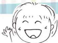
▲アンケートに描いていただいたイラストです♪

スマホ、薬物乱用、いじめ、不登校など子どもたちを取り巻く課題は山積しています。子どもたちのためのPTA活動を通じて、私たちが知恵と工夫と「笑顔」で乗り越えていきたいですね。今回も10月号(Q1、Q2)に引き続き、中P連のアンケート調査から「笑顔のコツ」をご紹介しますので、参考にしてみてください。 まとめ