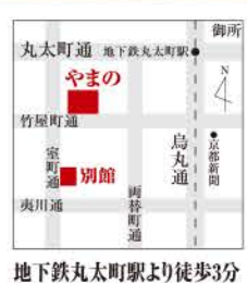
地下鉄丸太町駅より徒歩3分