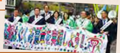
憲法月間人権啓発パレード

12月8日(土) ★子どものために大人が頑張る 一大イベント!! PTAフェスティバル ●みやこメッセ