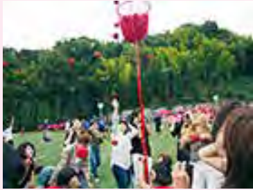
体育祭で玉入れに参加するPTAの皆さん