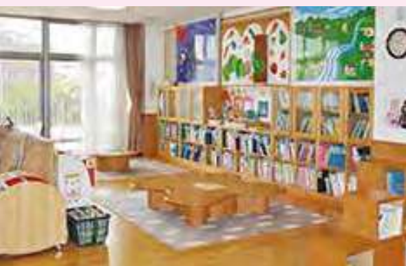
幼稚園には、おもしろそうな絵本がいっぱい! (みつば幼稚園絵本室)