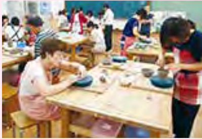
陶芸教室で、オリジナルの陶器を作成