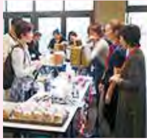
文化祭で、クッキー等を販売

3校で行うPTA活動最後の年、会員間のコミュニケーションも深まり、内容の濃い活動になりました。