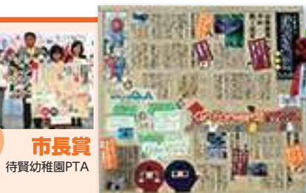
市長賞 待賢幼稚園PTA