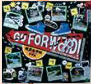
実行委員長賞 椋原中学校PTA