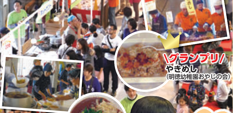
「グランプリ」やきめし (明德幼稚園おやじの会)