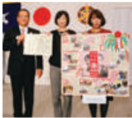
実行委員長賞 二条中学校PTA