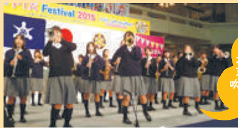
▲京都市立久世中学校吹奏楽部