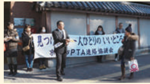
人権尊重街頭啓発活動

を前面に打ち出して、広く市民に訴えかけたところです。私たち保護者が自分たちの課題として向き合い、子どもを見守ることが大切ではないでしょうか。