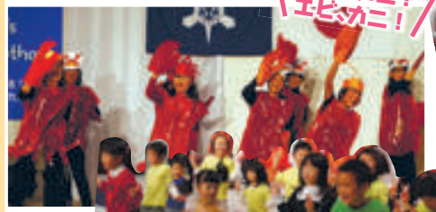
▲幼稚園 PTA 連絡協議会