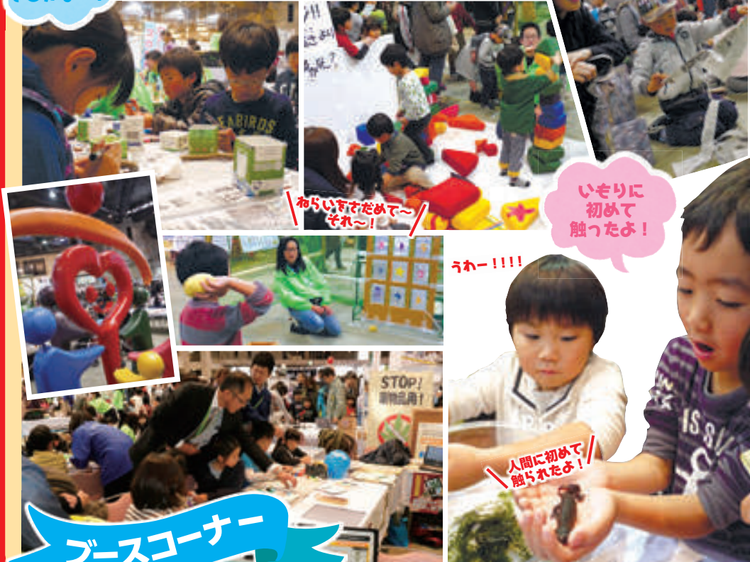
わらわさだめで〜それ〜!