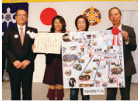
市長賞 下京中学校PTA