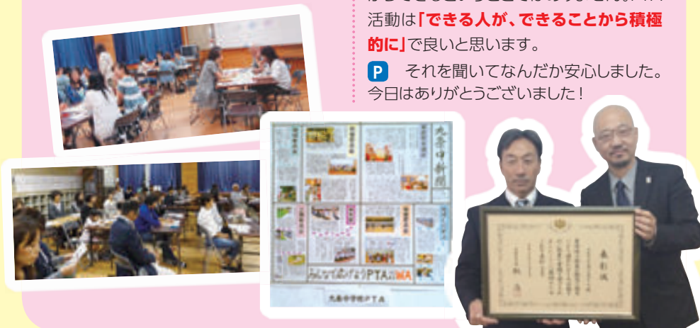
左:西谷校長 右:高橋会長