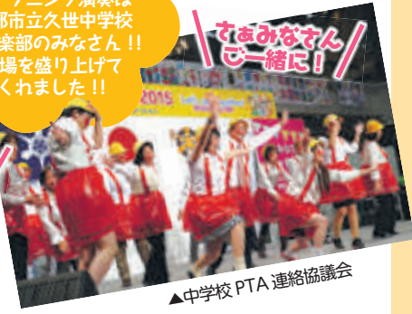
▲中学校 PTA 連絡協議会

オープニング演奏は京都市立久世中学校吹奏楽部のみなさん!! 会場を盛り上げてくれました!!