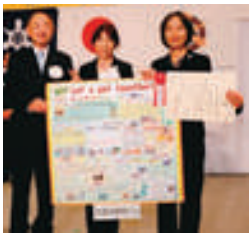
教育長賞 呉竹総合支援学校PTA