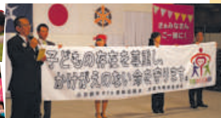
▲京都はぐくみ憲章アピール