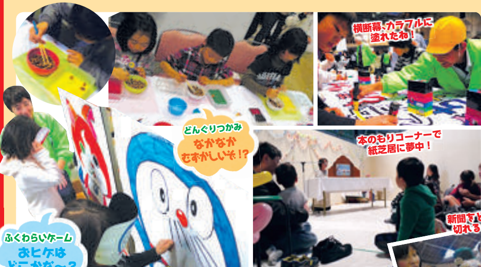
横断幕、カラフルに塗れたわ!