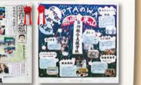
九条中学校PTA 塔南高等学校PTA 白河総合支援学校PTA