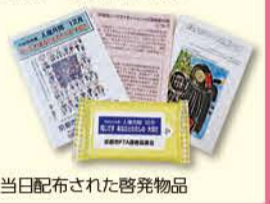
当日配布された啓発物品