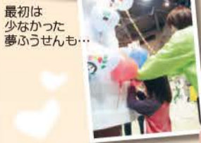
最初は少なかった夢ふうせんも...