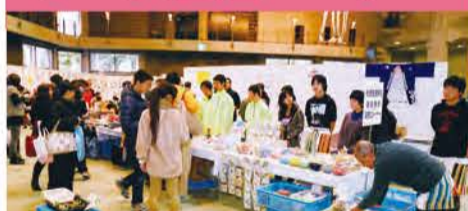
総合支援学校の製品展示・販売♪たくさんの人にご来店いただきました!