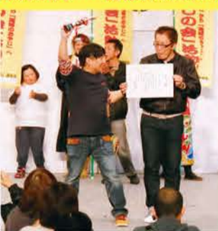
グランプリを受賞した太秦小学校おやじの改

※グランプリとは... 当日の投票で、最も多くの票を集めたメニューに贈られる賞です。