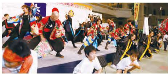
「ドリームロックソーラン vol.2」 伏見南浜小学校 PTA おやじの会