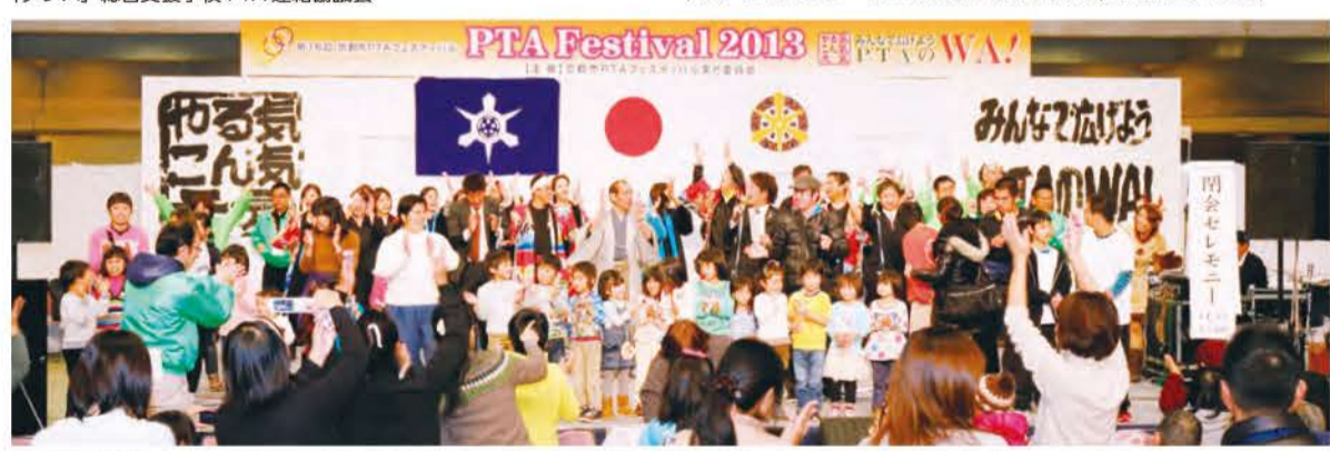
全員合唱 [WAになっておどろう] 第16回PTAフェスティバルは、大盛り上りのうちにフィナーレを迎えました!!