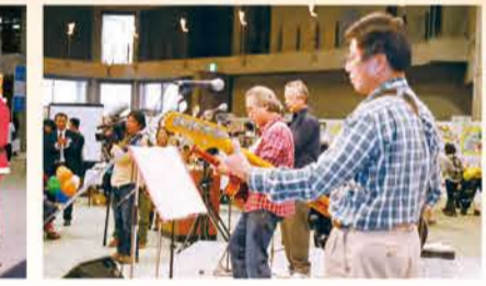
「バンド演奏」 修学院中学校 PTA おやじバンド「はらっば」