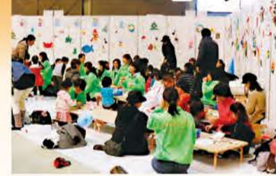
幼稚園PTA連絡協議会は子どもたちで大にぎわい!