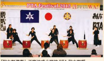
「和太鼓演奏」 下京涉成小学校 PTA 和太鼓部