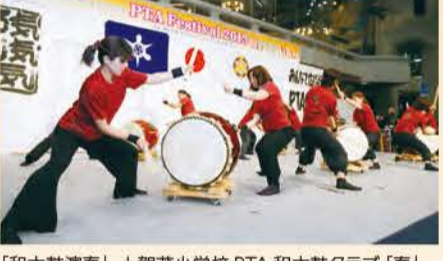
「和太鼓演奏」 上賀茂小学校 PTA 和太鼓クラブ「奏」