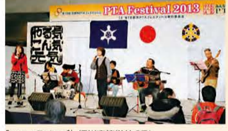
「フォークソング」 堀川高等学校 PTA