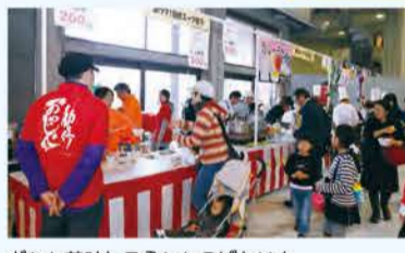
どれも美味しそうなおもてなし☆ 選ぶのが大変だ!