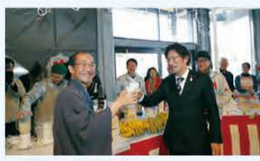
門川市長もご満悦の様子