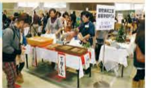
銅駝美術工芸高等学校PTA (手作り市)