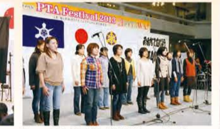
「コーラス」 川岡東小学校 PTA コーラス部