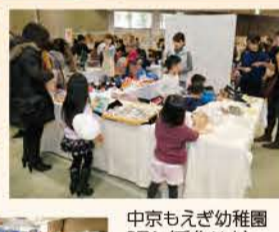
中京もえぎ幼稚園 PTA (手作り市) 待風小おやじの会 (スライムづくり)