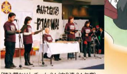
「読み聞かせ」 チーム 24 (中P連 24 年度)