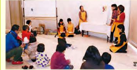
物語の世界へ入り込む子どもたち