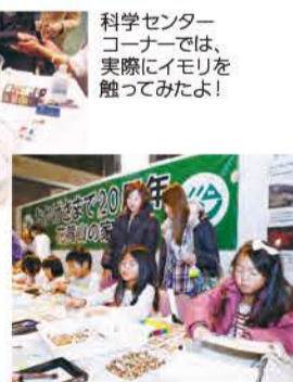
科学センターコーナーでは、実際にイモリを触ってみたいよ!