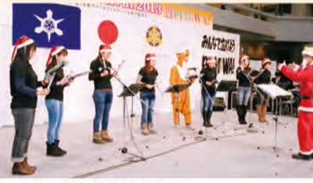
「トーンチャイム」 常磐野小学校 PTA