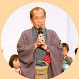
門川市長挨拶 (開会式)