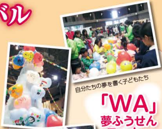
自分たちの夢を書く子どもたち