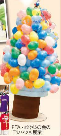
PTA・おやじの会 Tシャツも展示