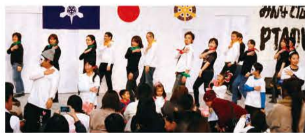
「ダンス」 総合支援学校 PTA 連絡協議会