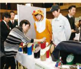
洛陽工業高等学校PTA (UFOキャッチャー・株式会社洛陽アントレプレナー)