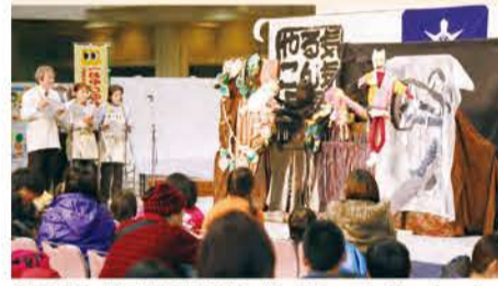
「人形劇」 松尾小学校 PTA 絵本サークル「もこもこ」