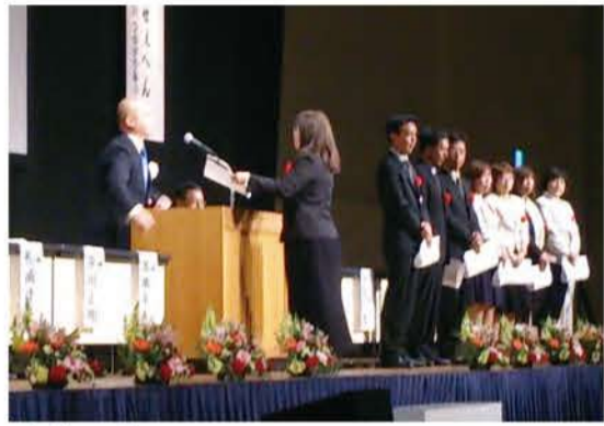
近畿ブロック表彰

11月7日、第39回近畿ブロックPTA研究大会神戸大会が開催されました。開会式では近畿ブロック表彰(団体及び個人)が行われ、その後に行われた記念講演では、先天性の四肢欠損症で生まれ