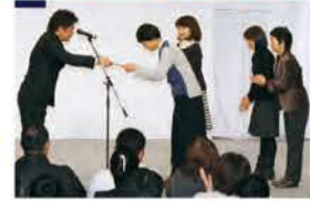
市長賞を受賞した梅小路小学校! おめでとうございます!!