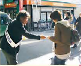
街頭にて啓発物を配布