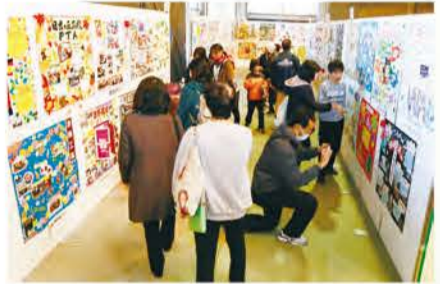
にぎわう壁しんぶんコーナー