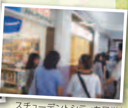
京都モノづくりの殿堂を見学!