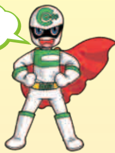
クーリング・オフマン