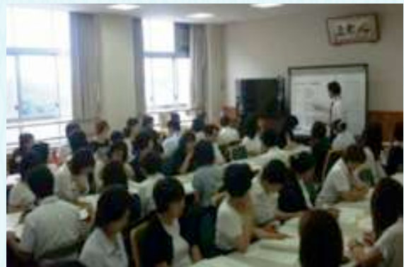
企業訪問時の心得の説明を聞く参加者

子どもにも今日のことを伝えて、実習させていただけるありがたさを伝えようと思います。