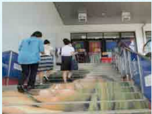
職場開拓に向かう参加者

挨拶だけで終わった会社もあり、実習、雇用の道の険しさを感じた一日となりましたが、保護者と教員がともに取り組めたことは今後に向けて大きな成果となりました。