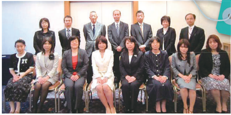
平成24年度新役員(前列左から4人目が清野会長)