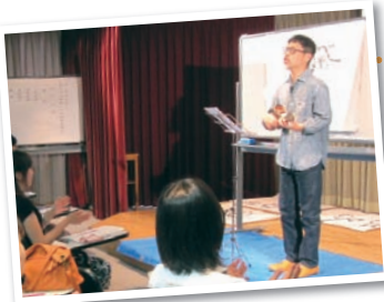
あつという間の一時半でした。