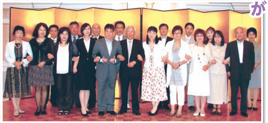
平成23年度会長(前列左から5人目)と平成24年度新会長(同7人目)らの顔ぶれ