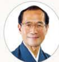
門川大作 京都市長

日時：平成23年11月11日(金) 午後2時～4時(午後1時30分開場) ※2時から30分間は同フォーラム総会を開催。