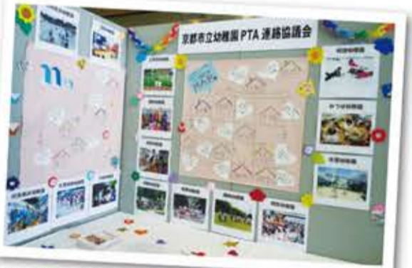
16 園の思いが詰まったパネル展示

「この活動は「ノーケータイデー」も加わり市P連全体で継続して取り組んでいます。幼稚園生活は長くて3年と短いけれど、子どもの人生の根っこを育てる場であり親子で向き合い互いに学ぶ、その時間が多いこの時期だからこそできる取り組みなのかもしれません。」