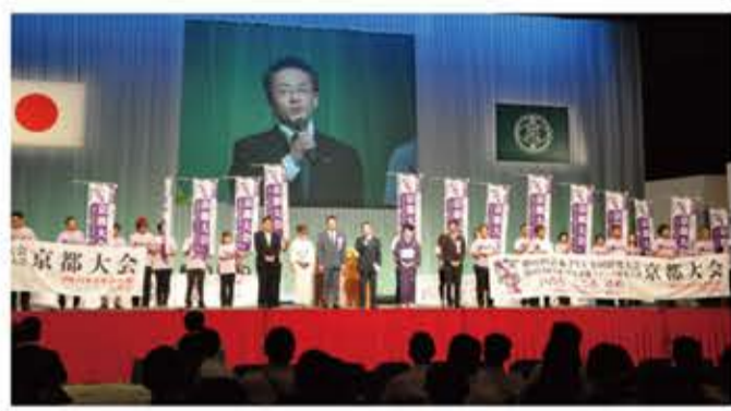
ひろしま大会の全体会会場で京都大会のPRをする実行委員のメンバー

「きんさい! みんさい! やりんさい! 子どもたちの笑顔のためにがんばろう日本! 平和な未来へ「ひろしまからの発信」のスローガンのもと、8月26日・27日に開催されました。 来年度開催地である京都からは府市合わせ200名が、26日は広島県各地10会場で開かれた分科会ごとに分かれ、持ち味を出した京都大会のPRをしたり分科会運営のノウハウを教えて頂いたりしました。27日は広島市のグリーンアリーナで行われた全体会に集結し全国から集まった8,000人のPTA会員の前で京都大会のPRをして参りました。 分科会では、広島出身の著名人などのテーマに添った基調講演、そしてパネルディスカッションでは子どもたちのための良い環境づくりなどについて討議し、全体会では乙武洋匡氏による「みんなちがって、みんないい」の講演と原田真二氏による復興支援コンサートの後、子どもたちとPTA会員8,000人で「ヒッピー」を大合唱しました。とても感動的なフィナーレで日本の子どもたちのために、これからも私たち大人が力を合わせて頑張らねばと思いました。 最後に広島の方々の人情味厚い「もてなし」に触れさせて頂いた事に感謝し、来年の京都大会でも「おもてなしの心」で全国の皆様をお迎えできるよう準備をすすめていきたいと思います。 白P京都大会実行委員会