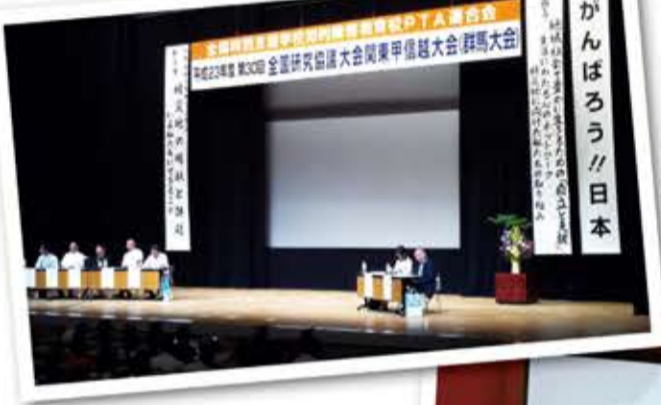
▲全知P連「群馬大会」の様子

全肢P連「神奈川大会」は、8月21日(日)〜22日(月)に、パンパシフィック横浜ベイホテル東急にて、「みんなともだち新たな一歩」〜東日本大震災にあわれた子どもたちへ〜をスローガンに、「子どもたちの一人一人のニーズに応じた特別支援教育・肢体不自由教育の取組および共生社会づくりの為にPTAはどうかあるべきか」を研究主題におき、基調講演、分科会、会員研修会が開催されました。「(新)子どもたちをとりまくネットワーク」を充実させる実現に向けて、みんなで知恵を出し合い実行する、みんなの力でみんな 生活が困難、簡易トイレで用を足せない、医療的支援が必要など、避難所で生活できないことで食料や物資の配給が受け取れないケースもあり、福祉避難所の指定が必要との声が多くありました。また、子どもにはサポートブックや緊急カードを必ず持たせる、薬・水などの備蓄、緊急時の連絡方法など、今から実行しなければならぬことはたくさんあると強く感じました。