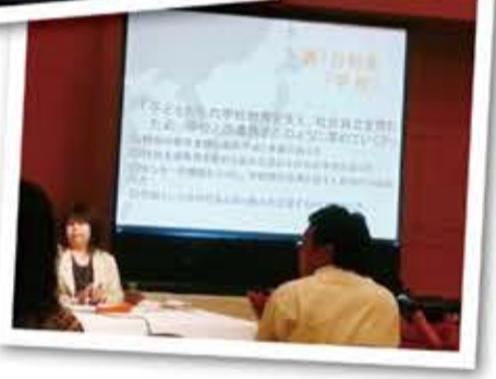
▶全肢P連「神奈川大会」分科会の様子